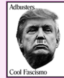
couverture de ADBUSTERS, Kalle LASN, 2016