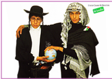
affiche, Oliviero TOSCANI, 1986