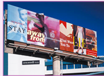
affiche, Jonathan BARNBROOK, 2001